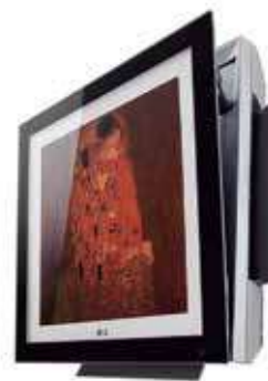
O Art Cool Gallery em outro ângulo

Além do design diferenciado, o Art Cool Gallery também conta com a tecnologia de ponta. Graças à tecnologia Inverter, ele tem a capacidade de resfriamento a jato e aquecimento rápido, em que o ar é liberado pelas laterais com fluxo direcional de três vias, mais suave. O compressor rotativo duplo de velocidade variável reduz o ruído à 19db e no modo silêncio à 3db – como efeito de comparação