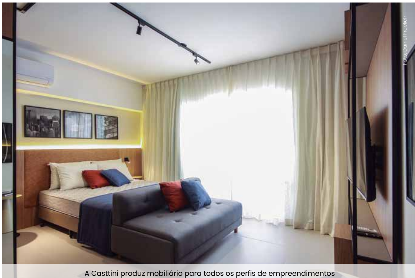
A Casttini produz mobiliário para todos os perfis de empreendimentos

Na hotelaria é sabido que ambientação e conforto são peças-chave para a composição de um espaço que atenda as expectativas dos hóspedes e crie memórias inesquecíveis. Além do impacto e encantamento visual, faz parte da missão da hotelaria, aguçar outros sentidos do hóspede durante a jornada, como uma oferta gastronômica marcante e a satisfação tátil de uma toalha, lenços e outros itens de cama macios, que proporcionam o relaxamento necessário para o bom sono. Essa é a premissa da Camesa, empresa que desde 1980 desenvolve e comercializa a mais completa linha de cama, mesa, banho e decoração do mercado. São produtos divididos em diferentes